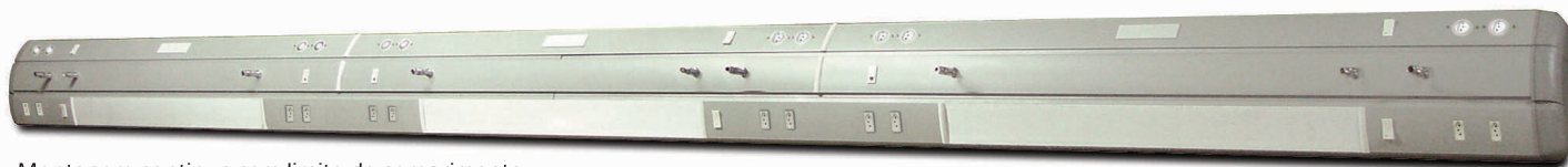
Montagem continua sem limite de comprimento