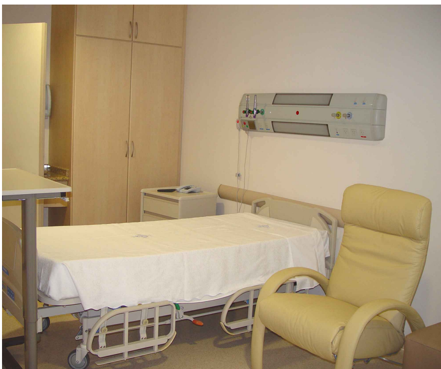
Foto ilustrativa em leito de apartamento