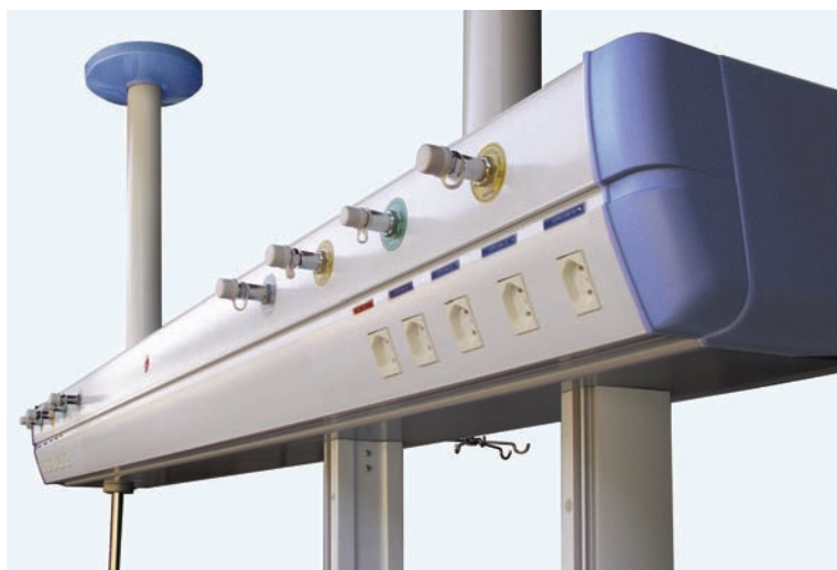
Tomadas elétricas universal 2P+T, conforme norma ABNT NBR 14136:2002.

As rosca dos pontos de gás são normatizadas de acordo com a ABNT NBR 11906:1992. A identificação dos gases é feita através de etiquetas com cores normatizadas conforme ABNT NBR 12188:2003. Tampão de PVC para proteção das rosca das conexões. Tubulação interna realizada através de mangueiras em poliuretano, devidamente identificadas pela cor conforme normas vigentes.