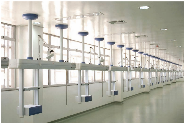
Projeto conforme a necessidade do cliente

Os painéis Linha Delta têm como função direcionar a alimentação elétrica e de gases próximo aos equipamentos que estarão sendo utilizados dentro de uma unidade de terapia intensiva, tais como ventiladores pulmonares, monitores de sinais vitais, bombas de infusão, etc. A forma construtiva do produto permite melhor distribuição destes equipamentos, além de permitir ao usuário mobilidade, ergonomia, facilidade no manuseio e conseqüentemente agilidade nos procedimentos.