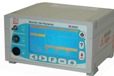
Monitor de paciente com ECG e oximetria de pulso e PANI