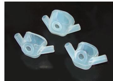
Máscaras em Silicone Autoclavável Tamanhos: pequeno, médio e grande