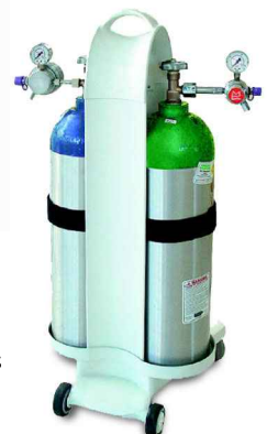
Conjunto portátil de cilindros (Opcional)