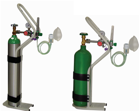
Leves, de fácil manuseio, para atendimento de emergência.