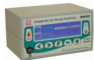
Oxímetro de Pulso Para mesa mod. 1000