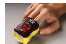
Oxímetro de dedo Digit